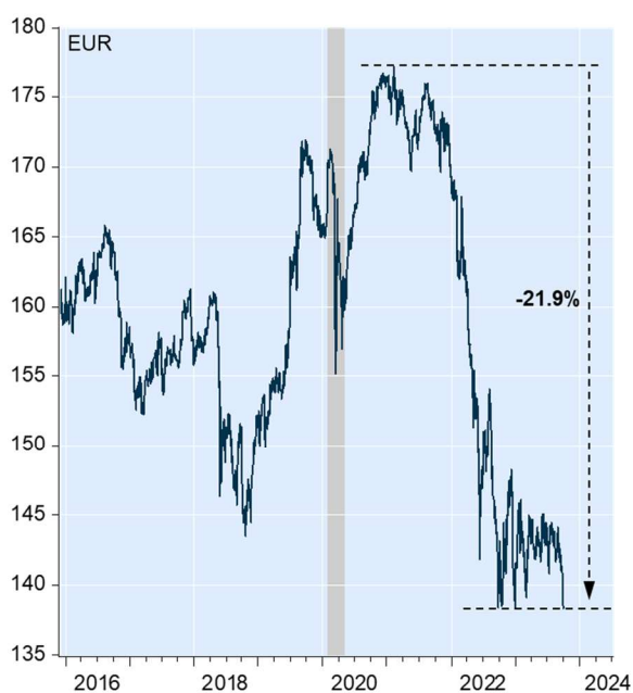
Fond négocié en bourse Ishares suivant l'évolution des obligations souveraines italiennes