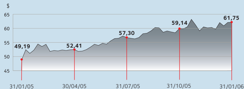
Performance du prix de l'action sur le TSX (NA)